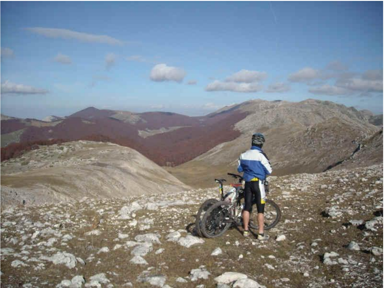
Foto 2 - Valle dei Codacchi

Si scende leggermente di quota e seguendo sempre il sentiero che scende verso la valle, bisogna girare a sx ( magari scendendo anche dalla mountain bike ) appena la pendenza lo consente raggiungere il fondo della Valle dei Codacchi. Si prosegue sempre in leggera discesa fino ad incontrare un segnavia in pietra che indica il confine tra Scanno e Pescasseroli. Si scende sempre all'interno di una splendida faggeta facendo attenzione a seguire bene il tracciato, abbastanza evidente, ed ad una evidente deviazione si svolta a dx ed imboccando la valle di Prato Rosso. La strada scende ancora, (lo farà fino a Pescasseroli), ed ad un incrocio svoltando a dx si raggiunge il rifugio di Prato Rosso (foto sopra). Tornando all'incrocio dobbiamo comunque svoltare alla seconda a sinistra e, proseguendo su una interminabile discesa' si entra direttamente nell'abitato di Pescasseroli.