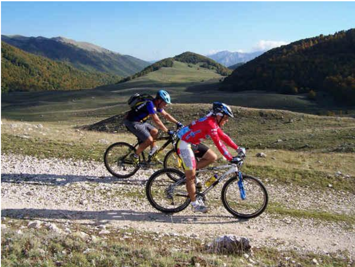
Foto 1 - L'altopiano di Ferrojo

Il percorso parte dalla piazza del paese e prosegue in direzione di Villetta Barrea. Si svolta a dx dopo circa 1 Km dove una strada sterrata evita di percorrere l'asfalto. Dopo circa 2 Km. si raggiunge la località " Le Prata " dove inizia l'evidente sterrata che ci condurrà alle sorgenti del fiume Tasso. Questo itinerario, escludendo appunto la sorgente del Tasso, si caratterizza per l'assoluta assenza di sorgenti, particolare da non sottovalutare soprattutto nella stagione estiva. Si sale ancora fino a raggiungere la sella di Ziomass per svoltare a dx fino a raggiungere una cava (un evidente scavo che interrompe la continuità del profilo del terreno) da dove si prosegue mantenendo sempre la destra fino a raggiungere la sella con vista panoramica sul pianoro di Ferrojo ( vedi foto) e le creste dei monti della Camosciara.