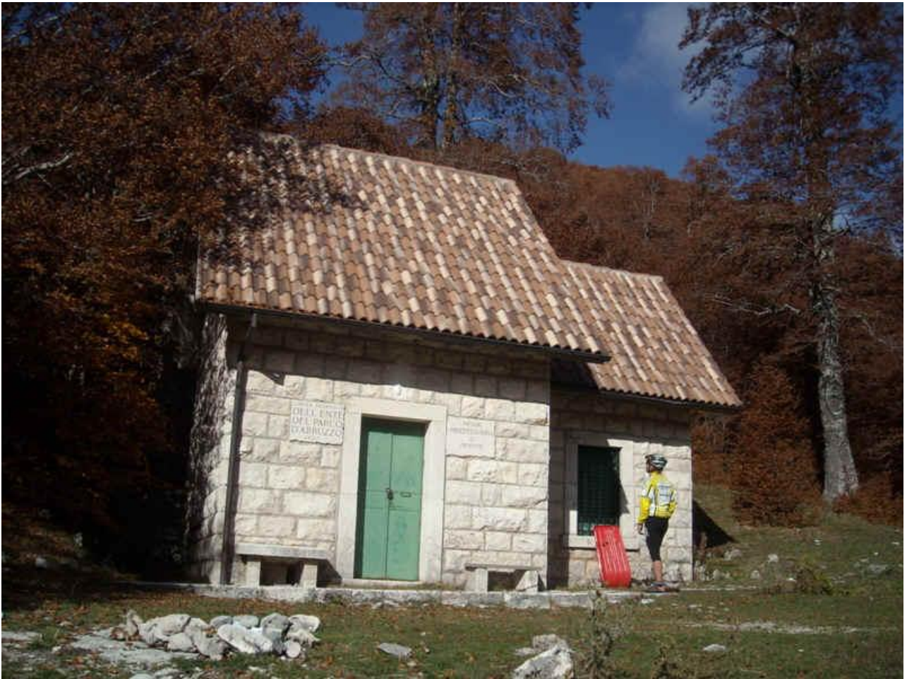
Foto 3 - Rifugio di Prato Rosso