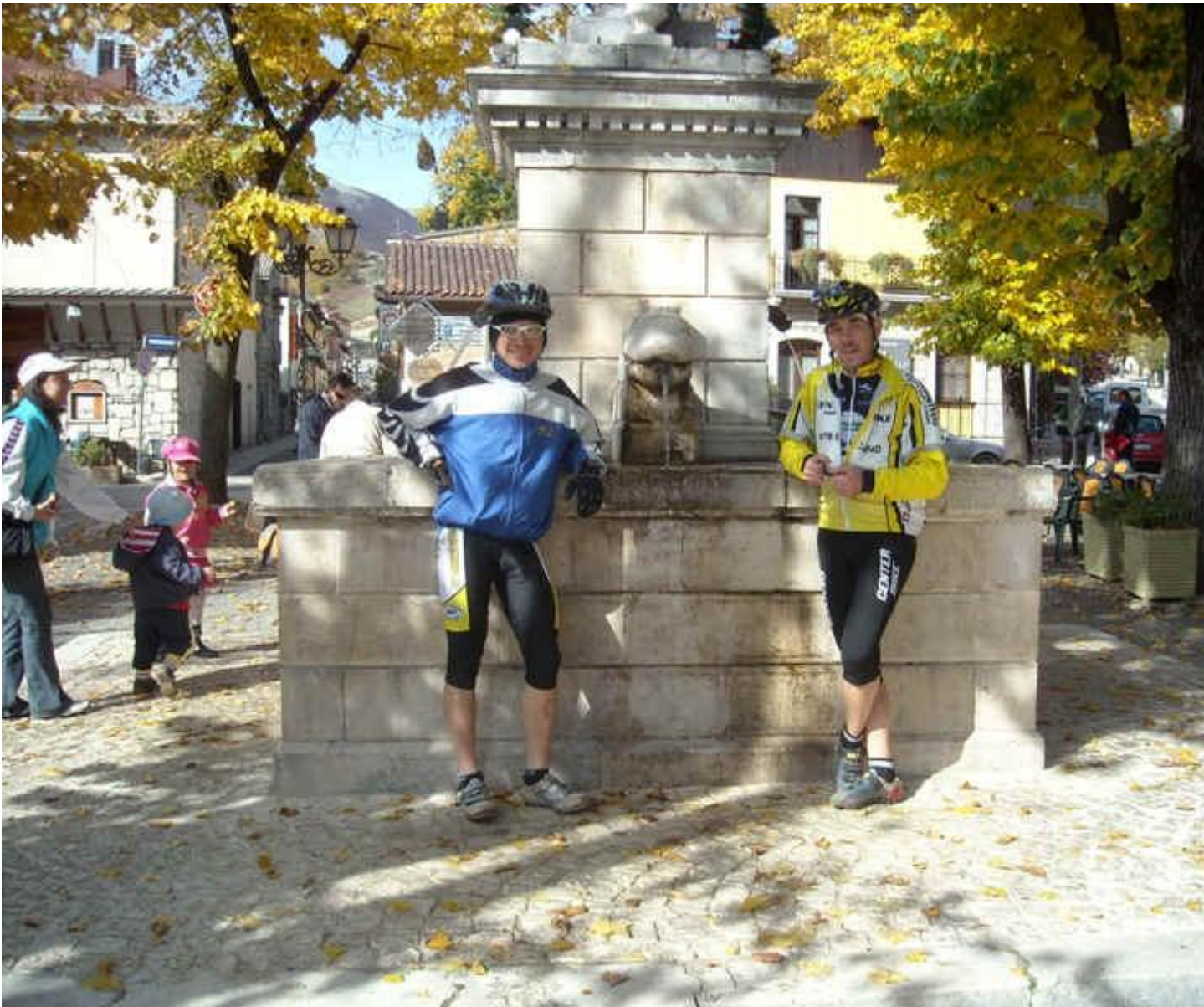
Foto 4 - In piazza a Pescasseroli

Il percorso sopra descritto, presentato per l'utilizzo in mountain bike, può essere percorso anche per attività di trekking sia a piedi che a cavallo ed alcuni versanti si prestano anche per la pratica dello sci alpinismo.